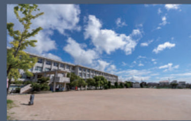
▲ 本館校舎と広いグラウンド

池田高校では「制服」ではなく「標準服」制度を採用しています。どういった服装が高校生活や学習の場に臨むのにふさわしいのか、一人一人が考えて行動しています。