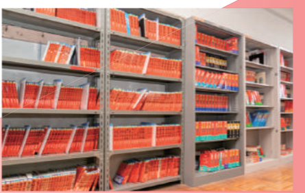
▲「赤本」約1,500冊などの資料を揃える進路閲覧室

また、進路閲覧室では、自分の進路に関する必要な情報を入手できるよう、各大学の資料や過去の入試問題、進路を考える上で有益なデータを数多く揃えています。